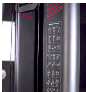
TABLEAU DES EXERCICES

Différentes hauteurs de poignée pour une plus grande adaptabilité à tout utilisateur.